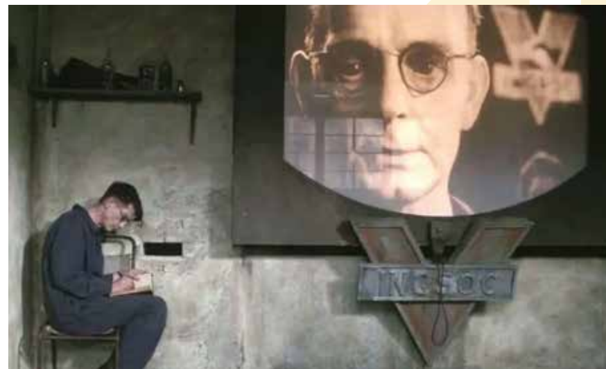
Ecranizarea romanului 1984 lansată chiar în anul 1984, cu John Hurt în rol principal