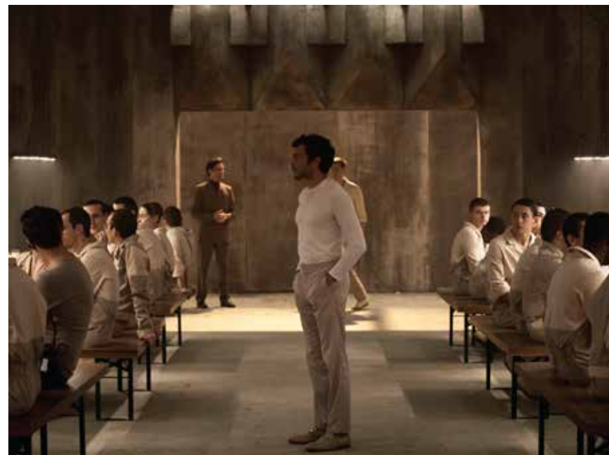
Serialul Brave New World produs în 2020 de NBC Universal Peacock

Publicații online contemporane românești care se bazează în mod esențial pe satirizarea societății și a întâmplărilor de zi cu zi sunt TimesNewRoman.ro (cotidian independent de umor voluntar) și Cațavencii.ro.