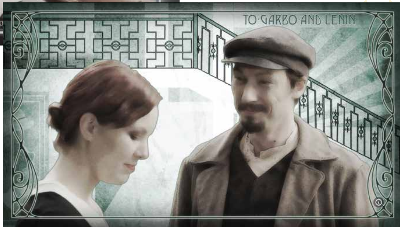
Secvențe din scurtmetrajul To Garbo and Lenin / Garbo och Lenin realizat cu tehnici mixed media