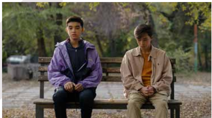
Captură ecran Chicken

Este mai mult o rutină neobișnuită decât ceva ce face conștient că ar produce orice fel de schimbare.