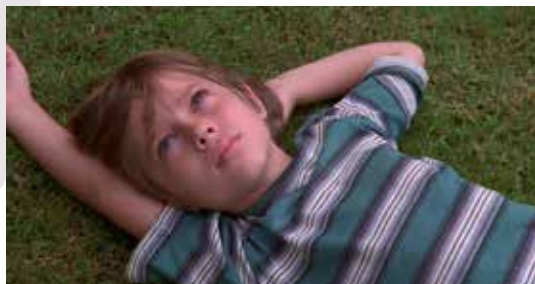
Captură ecran Boyhood

*Fun Fact: Cineastul american a realizat și un experiment cu ocazia acestui film, filmând timp de 12 ani cu aceiași actori, astfel încât să atingă un nivel de autenticitate cât mai ridicat. Citiți mai multe despre Boyhood în fișa filmului Nest . 9