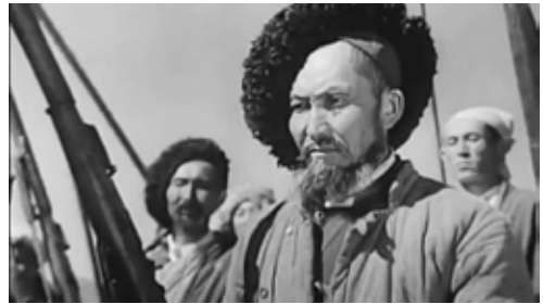
Captură ecran Amangeldy

În perioada contemporană, regizori precum Darezhan Omirbaev și Sergei Dvortsevov au adus recunoaștere internațională cinematografului kazah. Filmul Tulpan (2008) al lui Dvortsevov a câștigat premiul „Un Certain Regard” la Festivalul de Film de la Cannes, iar The Old Man (2012) de Ermekek Tursunov a fost nominalizat la premiile Oscar pentru Cel mai bun film străin. Începând cu 2019, odată cu adoptarea Legii Cinematografului național, Kazahstanul produce peste 30 de lungmetraje anual, ceea ce reflectă o industrie din ce în ce mai dinamică. 6