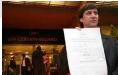
Sergei Dvortsevov, Closing Ceremony of Un Certain Regard (Sergei Dvortsevov la decernarea „Un Certain Regard”)