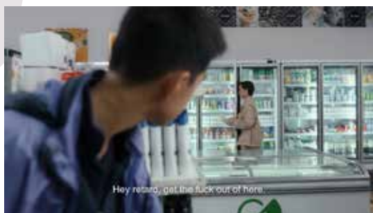
Capturi ecran Chicken