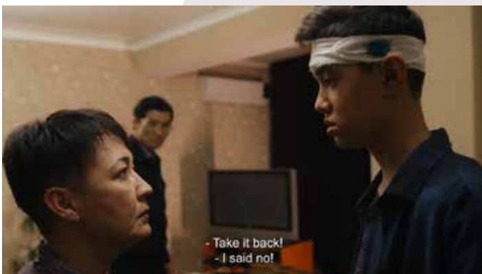
Capturi ecran Chicken