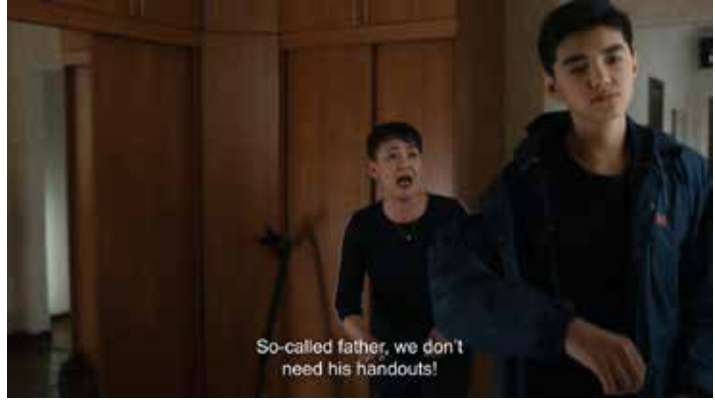
Captură ecran Chicken

Mama lui Artur, blândă, dar supraprotectivă, care nu înțelege de ce ea și fiul ei trebuie să treacă prin necazurile prin care trec și, la pol opus, mama lui Karim, care își varsă furia cauzată de abandonul fostului soț pe băiatul său, făcându-l deliberat să sufere la orice întrevedere cu acesta și reproșându-i că acceptă cadouri de la el.