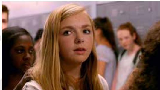
Captură ecran Eighth Grade

Printre cele mai grăitoare exemple este lungmetrajul Boyhood (r. Richard Linklater, 2014), ce urmărește povestea vieții lui Mason (Ellar Coltrane) din copilărie până în primul an de facultate*. Alte filme notabile în cadrul genului sunt: Ferris Bueller's Day Off (r. John Hughes, 1986), Eighth Grade (r. Bo Burnham, 2018) sau Lady Bird (r. Greta Gerwig, 2017).