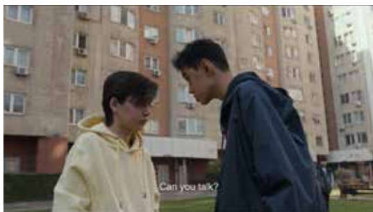
Capturi ecran Chicken

Acum, ar fi nevoie într-adevăr să se facă diferențierea între forme similare cu ceea ce înseamnă retard cauzat de stres post-traumatic și retardul în sine . Da, în situații de șoc pot apărea, periodic cel puțin, anumite declinuri cognitive, dar asta nu înseamnă că avem retard. Asta înseamnă că resursele noastre, inclusiv cele intelectuale uneori, sunt blocate, așa cum și băiețelul din film avea blocată capacitatea de a vorbi. El nu vorbește iar cei din jur îl consideră retardat. Aici e o dificultate, într-adevăr, destul de mare să se facă diferențierea, să înțelegi că nu-i vorba de retard, ci de alt tip de suferință emoțională, care afectează și capacitatea asta. Căci, da, sunt cazuri de genul ăsta. Uneori mai toate capacitățile sunt afectate. Există persoane care se retrag într-o stare de catatonie completă, nu mai vor să vorbească cu nimeni, nu mai aud, nu mai văd, sunt doar în lumea lor, cumva. Ceea ce e foarte greu de dus.”