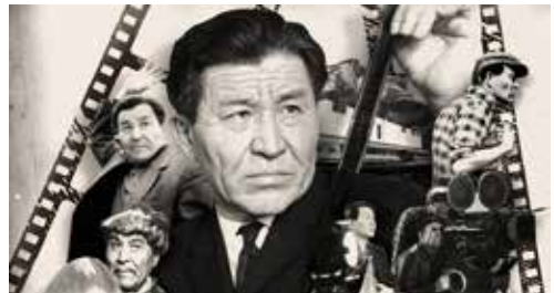
Shaken Aimanov