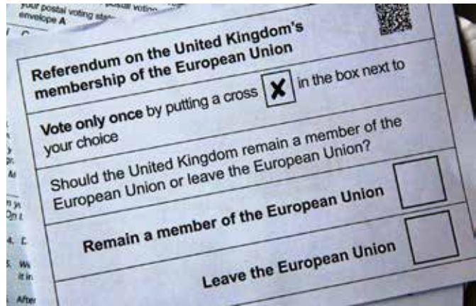
Sursă foto: britannica.com - www.britannica.com/topic/United-Kingdom-Independence-Party

În ciuda promisiunilor de prosperitate ale inițiatorilor Brexit-ului, economia Regatului Unit încă are de suferit, la mai bine de 4 ani de la separarea istorică. Penuria de produse, taxele mai mari sau inflația crescută sunt doar câteva din efectele acestui acord, pe care britanicii au început să îl regrete încă dinainte de a fi ratificat. 6