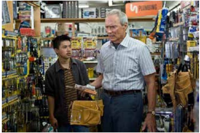
Captură ecran Gran Torino (2008, r. Clint Eastwood)

În mod neașteptat pentru amândoi - având în vedere că Gordon era obișnuit să respingă oamenii, iar Musa dorea doar să-și ajute vărul să intre în țară -, timpul petrecut împreună îi apropie. Cei doi învață unul de la celălalt și își depășesc barierele, respectiv se maturizează, devenind personaje mai complete pe parcurs.