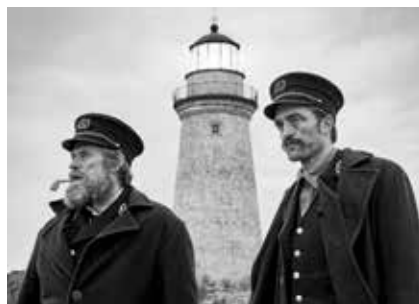
Captură ecran The Light Between Oceans (2016, r. Derek Cianfrance)