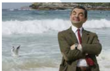
Captură ecran Mr Bean (1990-1995)