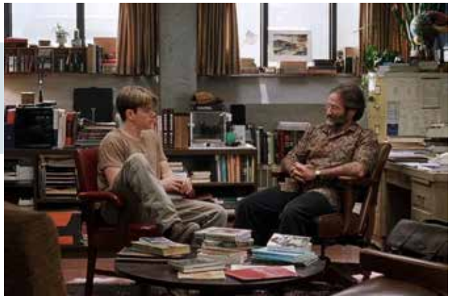
Captură ecran Good Will Hunting (1997, r. Gus Van Sant)