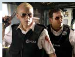
Captură ecran Hot Fuzz (2007, r. Edgar Wright)