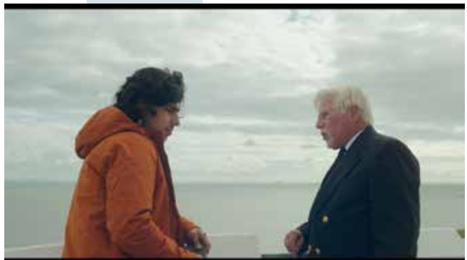
Captură ecran Keep