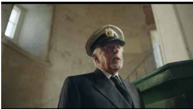
Captură ecran Keep

„Învăța să înveți” poate deveni o resursă cognitivă și emoțională extrem de prețioasă pentru a întâmpina orice revoluții tehnologice sau industriale ar putea veni în viitor.