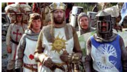
Captură ecran Monty Python and the Holy Grail (1975, r. Terry Gilliam & Terry Jones)

Umorelele britanice se disting prin câteva trăsături definitorii: este cel mai adesea sec, autoironic și strâns legat de cotidian. 10 Acest witty banter , cum l-ar numi englezii, este un mod de a dezamorsa tensiunea unor conversații, de a evidenția istețimea interlocutorului și de a menține un soi de beatitudine generală, indiferent de adversitățile vieții de zi cu zi.