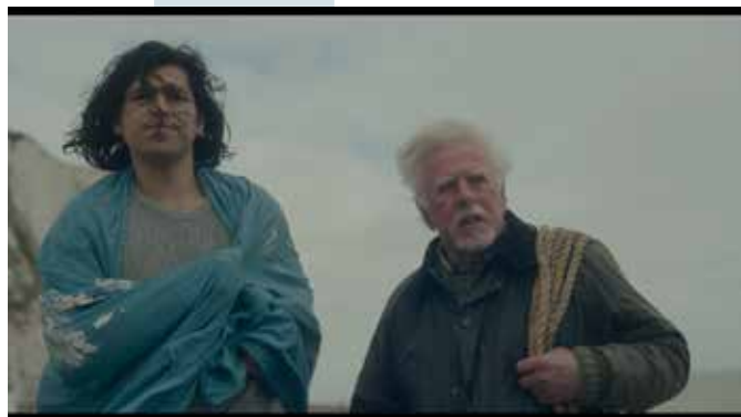
Capturi ecran Keep