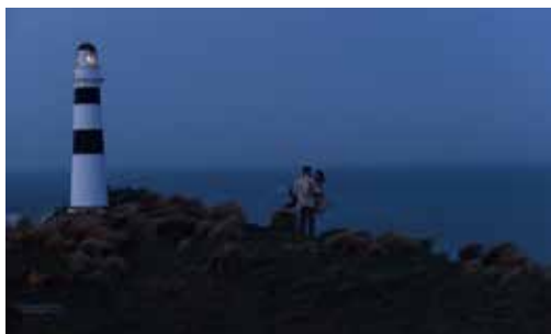
Captură ecran The Lighthouse (2019, r. Robert Eggers)

În schimb, în cinemaul clasic narativ, filmele tind să nu dea curs acestei simbolistici sinistre, preferând în schimb o direcție artistică și narativă mai jovială. Printre acestea se numără The Lightkeepers (2009, r. Daniel Adams), The Light Between Oceans (2016, r. Derek Cianfrance) și chiar scurtmetrajul aflat în discuție, Keep , unde farul nu reprezintă un loc al pierzaniei, ci din contră, unul al regăsirii.