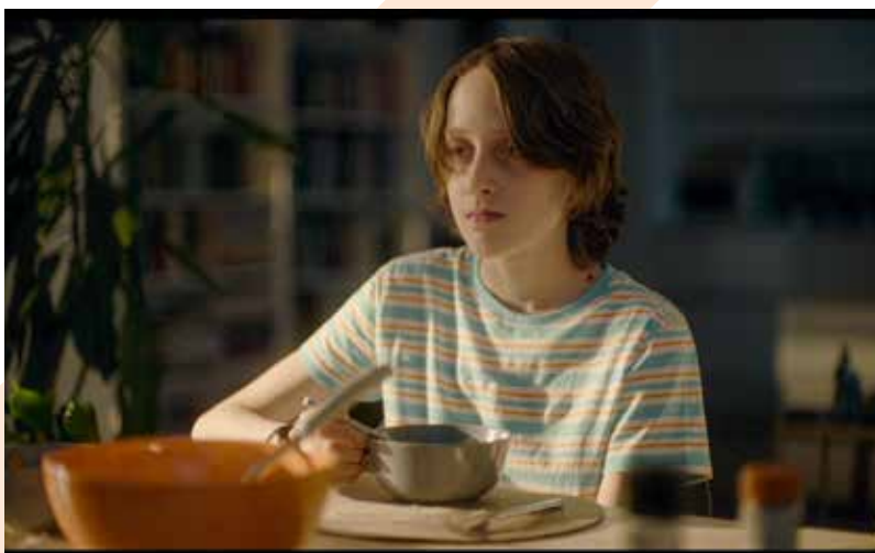
Capturi ecran Around the Corner