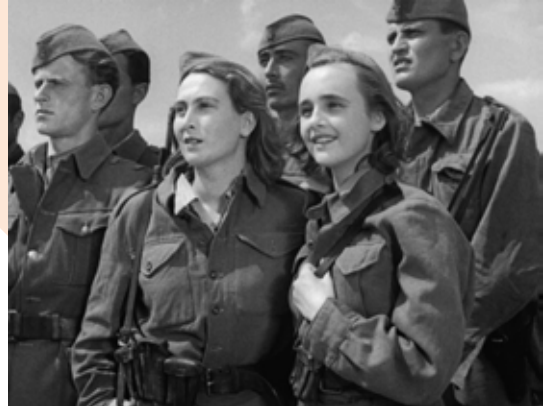
Captură ecran On our own land