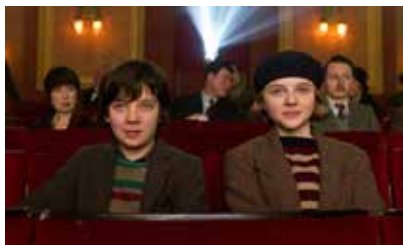
Captură ecran Hugo (2011)