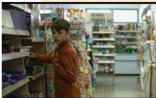
Capturi ecran Around the Corner