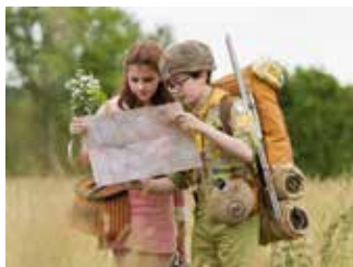
Captură ecran Moonrise Kingdom (2004)

Filmul produs de Studio Ghibli este printre cele mai clare exemple de perspectivă a copilului. Utilizând la maximum oportunitățile vizuale ale mediului animat, Miyazaki ne prezintă aventura fabuloasă a micuței Chihiro într-o lume a spiritelor. Întreaga poveste, eminentamente fantastică, poate fi pusă pe seama acestei priviri copilăroase a personajului principal.