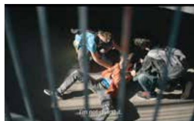
Captură ecran Around the Corner