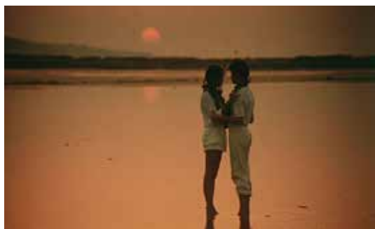
Captură ecran A Summer in a Sea Shell