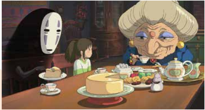
Captură ecran Spirited Away

De atunci, singurul alt anime câștigător la această categorie a fost tot un film realizat de Hayao Miyazaki, Kimitachi wa dô ikiru ka / The Boy and the Heron (2023), la ediția din 2024 a premiilor Oscar.