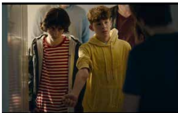
Capturi ecran Around the Corner