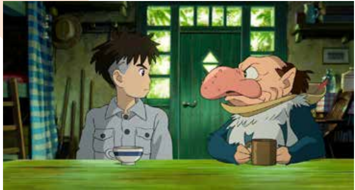
Captură ecran The Boy and the Heron