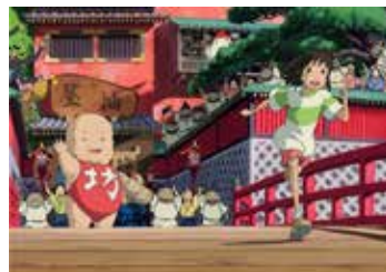
Captură ecran Spirited Away (2001)