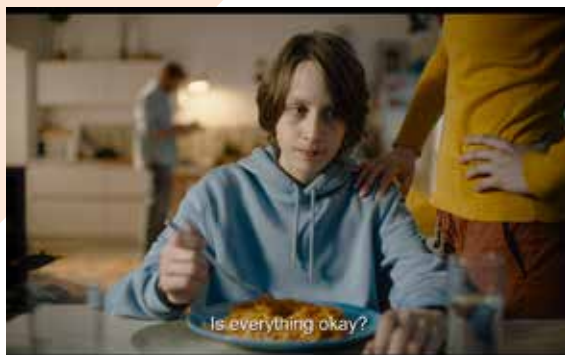
Capturi ecran Around the Corner