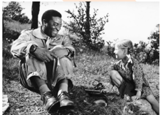
Captură ecran Valley of Peace