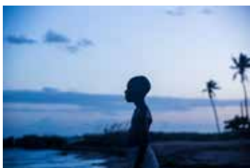
Captură ecran Moonlight