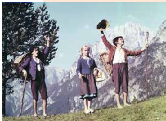
Captură ecran Good luck, Kekec