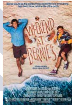
Poster Weekend at Bernie's, 1989, Ted Kotcheff.

Waking Ned, în care o comunitate de irlandezi se organizează să păcălească loteria că bătrânul Ned Devine trăiește, astfel încât să poată împărți ei biletul lui câștigător.