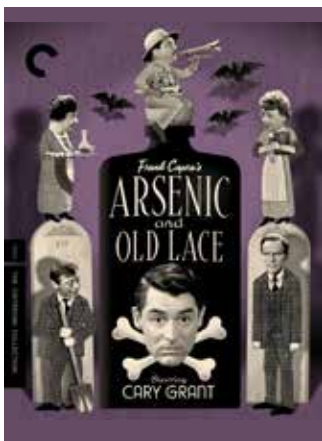
Poster Arsenic and Old Lace, 1944, Frank Capra.

Cary Grant, în Arsenic and Old Lace, din 1944. Ce te faci când afli că cele două mătușe adorabile pe care le vizitezi constant sunt de fapt ucigașe în serie?