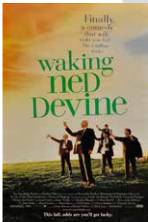
Poster Waking Ned, 1998, Kirk Jones.

Cary Grant, în Arsenic and Old Lace, din 1944. Ce te faci când afli că cele două mătușe adorabile pe care le vizitezi constant sunt de fapt ucigașe în serie?