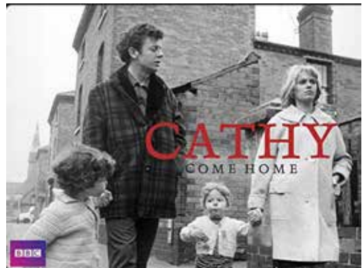
Poster, Cathy Comes Home , 1966, r. Ken Loach

Filmele lui Ken Loach, unul dintre părinții realismului britanic, activ până în zilele noastre, sunt printre cele mai grăitoare exemple. Docu-drama Cathy Comes Home spune povestea a doi îndrăgostiți care, din cauza apariției unui copil combinată cu un accident de muncă, ajung să-și piardă casa. Cei doi se chinuie să se repună pe picioare logistic și financiar, dar se lovesc de absurdul unui sistem care îi reduce în cele din urmă la a fi oameni ai străzii. Filmul a fost extrem de discutat la vremea lui (1966) fiind printre primele care vorbeau atât de aplicat despre oameni fără adăpost, lipsa de locuri de muncă, sau drepturile mamelor. În urma premierei pe postul de televiziune BBC1 și a reacției publicului, un an mai târziu, în Anglia se înființa asociația de caritate Crisis, dedicată oamenilor străzii și activă până în ziua de azi. 6